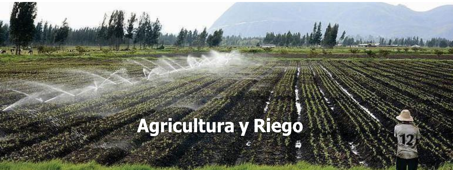
Agricultura y Riego