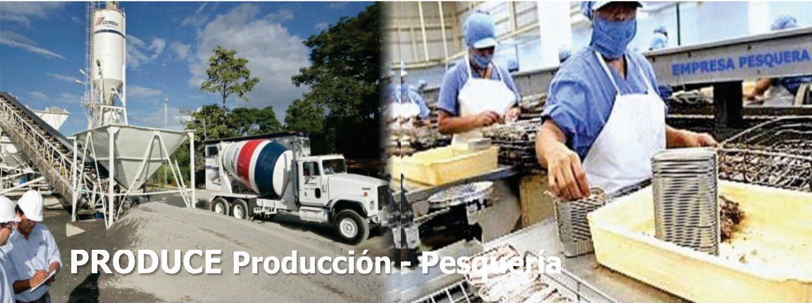
PRODUCE Producción - Pesquería