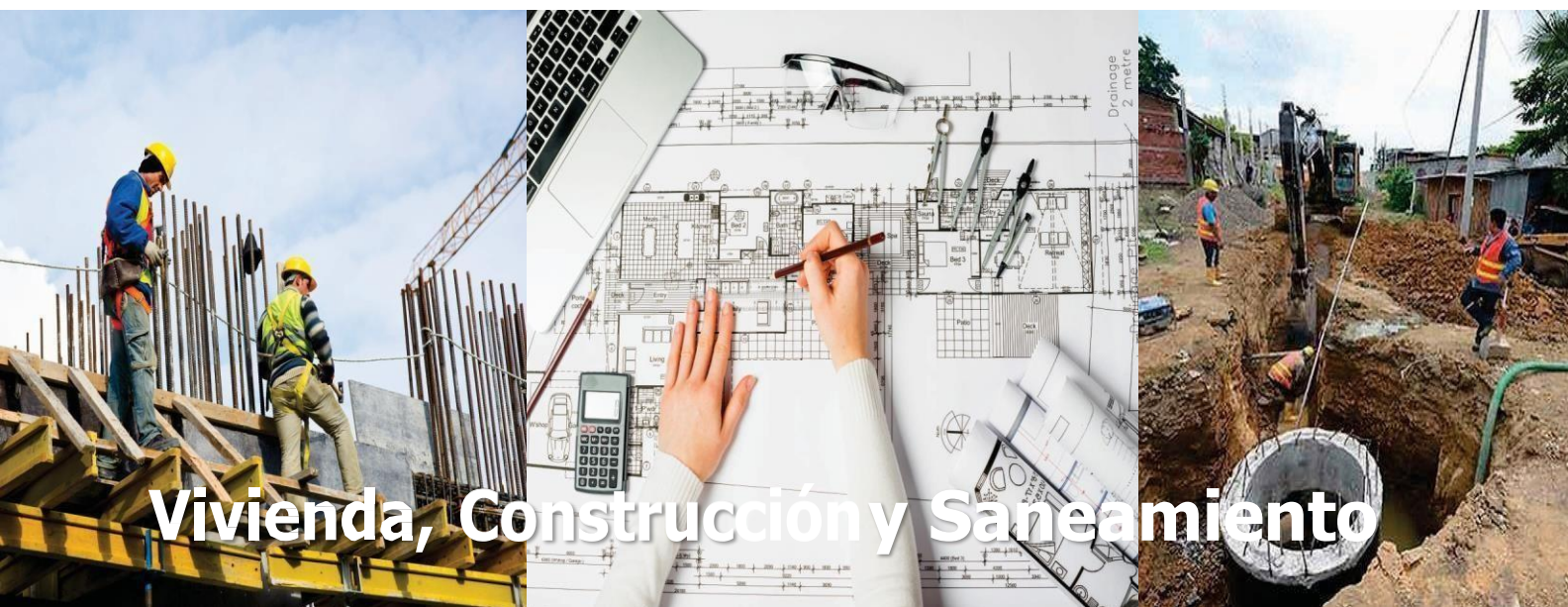
Vivienda, Construcción y Saneamiento